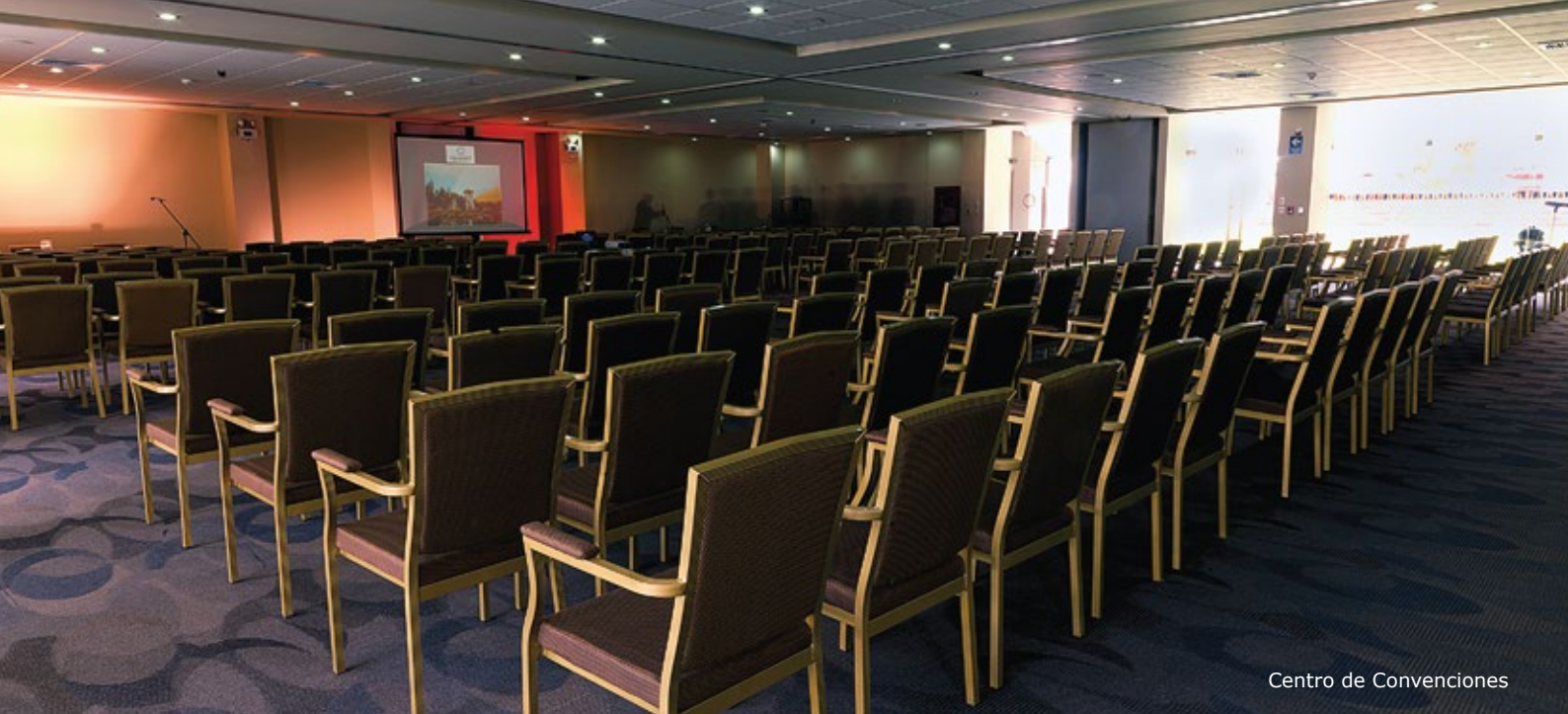
Centro de Convenciones