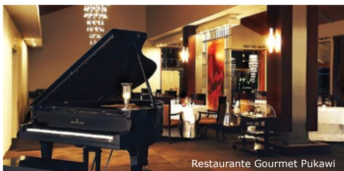
Restaurante Gourmet Pukawi

Cava selecta: para el perfecto maridaje.